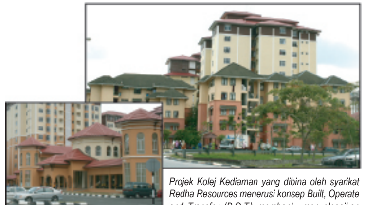
Projek Kolej Kediaman yang dibina oleh syarikat Redha Resources menerusi konsep Built, Operate and Transfer (B.O.T.) membantu menyelesaikan isu kediaman pelajar.

M enjelang akhir 2009, kampus induk KUIS dijangka mampu menempatkan hampir 8,000 pelajar apabila bangunan asrama siap sepenuhnya. Bangunan asrama yang dikendalikan pihak Redha Resources menerusi projek 'Built-Operate-Transfer' (BOT) telah siap fasa pertama pada sesi kemasukan Mei 2008. Menerusi fasa pertama itu, lima blok asrama mampu menempatkan kira-kira 2,500 orang pelajar siswi manakala asrama siswa pula berupaya memuatkan sehingga 4,000 orang apabila siap keseluruhan bangunan pada bulan September depan. Projek BOT bernilai RM125 juta itu turut dilengkapi Pusat Kemudahan Pelajar termasuk kafeteria, dewan bankuasi, kedai buku dan koperasi.