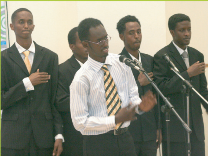
SATU HATI...Kumpulan pelajar antarabangsa dari Somalia menyampaikan persembahan pada majlis Makan Malam Pelajar Antarabangsa, di Dewan Bankuasi KUIS-Redha Resources pada 20 Jun lalu.