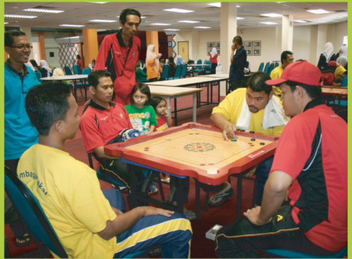
Peserta pertandingan karam menguji kecekapan mereka dalam karnival sukan melibatkan anak-anak syarikat MAIS termasuk KUIS, Lembaga Zakat Selangor (LZS) dan MAIS Corporation.