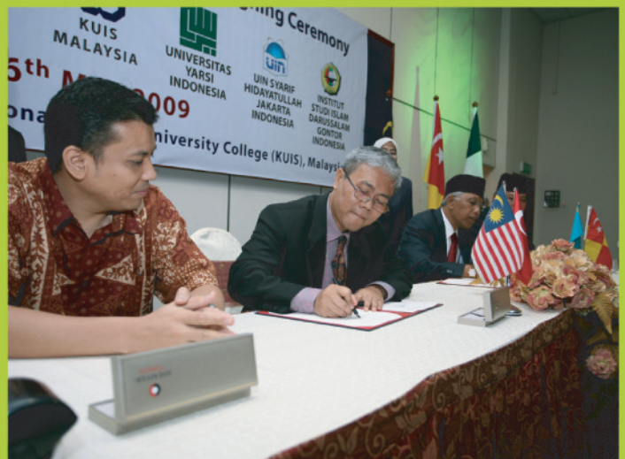
Bersejarah...Rektor KUIS menandatangani MoU dengan wakil-wakil institusi pengajian tinggi luar negara melibatkan Academy Of Banking, (Kazakhstan) Islamic University of Europe (Turkey), Universitas Andalas, Universitas Yarsi, Universitas Islam Negeri (UIN) Syarif Hidayatullah Jakarta dan Institut Studi Islam Darussalam Gontor (Indonesia).