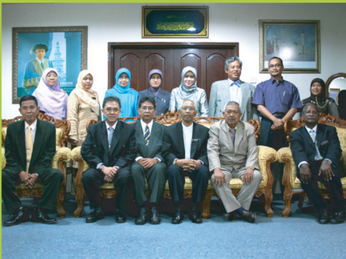
Kunjungan muhibah Walikota Banjar, Bandung bergambar kenangan dalam lawatan rasmi ke KUIS pada 20 Mei, 2009.