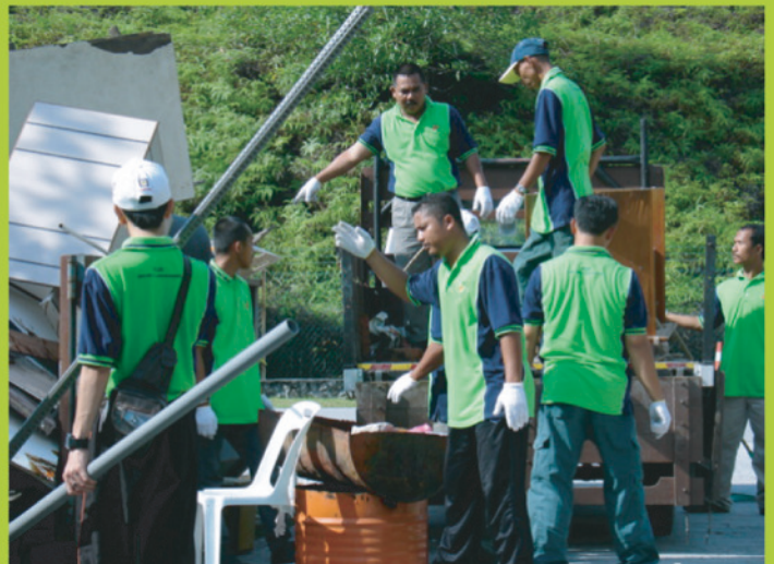
TA'AWUN...semangat kerjasama dan esprit de' corp di kalangan warga KUIS terpancar sempena program Gotong Royong Perdana 5S, pada 1 April 2009.