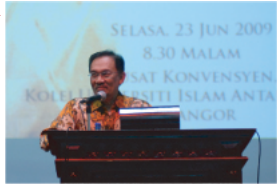
BERKONGSI ILMU... Anwar Ibrahim berpidato di depan pemimpin mahasiswa dan pelajar KUIS.