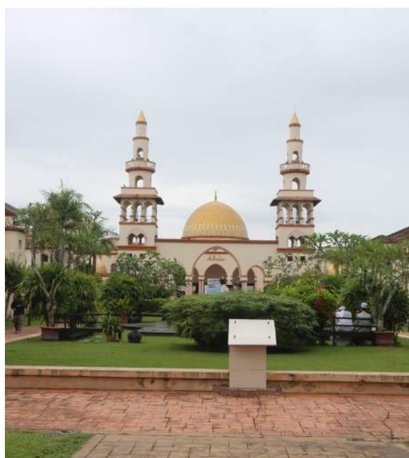
Masjid Al-Azhar KUIS

pengurusan masjid yang semakin meningkat. Di harap budaya berinfaq ini terus subur dibudayakan dalam kalangan kakitangan KUIS. Dalam masa yang sama, usaha berterusan harus dilakukan untuk mempromosikan Tabung Infaq ini demi meningkatkan bilangan peserta dan amaun infaq ini.