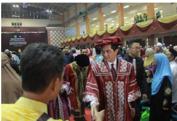
Y.A.B Dato' Menteri Besar Selangor beramah mesra dengan ibu-bapa graduan