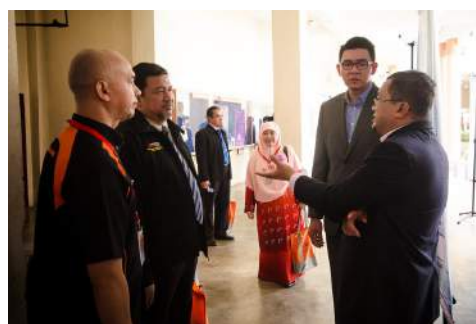
Dato' Rektor KUIS sedang menerangkan fungsi RMC kepada KUIS dan masyarakat.

Hari Terbuka RMC 2015 disudahi dengan Majlis Penyampaian Anugerah Penulisan Dalam Jurnal dan Penyelidikan Terbaik 2013 dan 2014. Majlis ini melihatkan beberapa ahli akademik KUIS menerima hadiah berupa sijil dan wang tunai atas hasil penulisan dan penyelidikan mereka. Semoga dengan pemberian anugerah ini, ia akan menjadi batu loncatan bagi ahli akademik KUIS untuk lebih berusaha untuk menjadi yang terbaik dalam penyelidikan dan penulisan akademik.