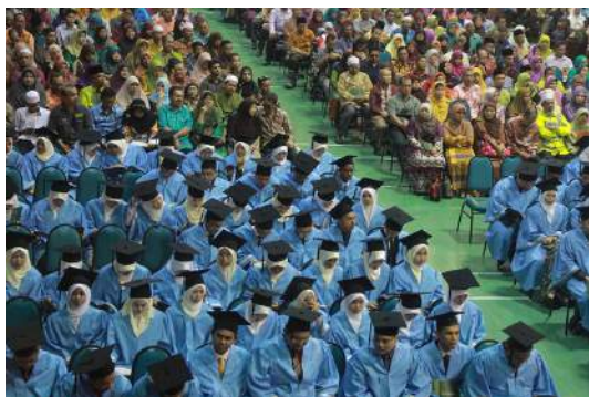
Para graduan sabar menunggu giliran naik ke pentas