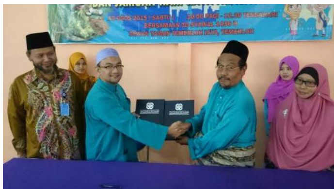
Sesi bertukar MoU antara KUIS dan Maahad Tahfiz Faqeh

Majlis menandatangani MoU tersebut dijayakan dalam suasana yang meriah bersempena dengan acara rumah terbuka Aidilfitri 1436 Hijriah anjuran MTF. Hadirin terdiri daripada ibu bapa dan pelajar MTF serta orang ramai yang tinggal disekitar bandar Temerloh.