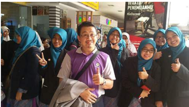
Timbalan Rektor meraikan Mahasiswa KUIS mengikuti Pertukaran Pelajar UNIDA Gontor.