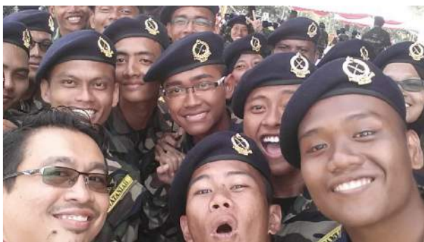
Bergambar kenangan bersama anggota Wataniah KUIS

Sebagai orang yang bertanggungjawab menjaga pembangunan mahasiswa KUIS, beliau amat mengambil berat serta menjaga kebajikan mahasiswa agar setiap mahasiswa diberi perkhidmatan terbaik semasa berada di KUIS. Bahagian Pembangunan Mahasiswa dan Bahagian Kediaman & Penempatan Mahasiswa adalah dua bahagian di bawah pentadbiran Timbalan Rektor Pembangunan Mahasiswa dan Alumni yang secara terus berhubung dengan pelajar berkaitan hal ehwal semasa pelajar seperti usrah, disiplin, penajaan dan bantuan kewangan, aktiviti pelajar serta penempatan dan kediaman pelajar. Semua perkara berkaitan hal ehwal pelajar perlu ditangani dengan bijak agar semua pihak berpuas hati dan tidak dibebani oleh masalah pihak lain yang boleh membawa keburukan pada masa akan datang. Sehubungan itu, staf dan pelajar KUIS perlu saling hormat menghormati agar suasana harmoni dapat diwujudkan.