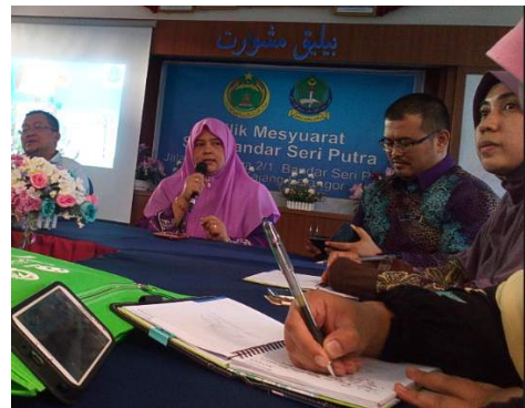
Sesi perbincangan berlangsung.

Selesai majlis perbincangan, delegasi KUIS dan pihak sekolah saling bertukar cenderahati dan tanda kenangan. Sebelum lawatan berakhir, delegasi KUIS dibawa melawat ke sekitar sekolah untuk melihat proses P&P yang sedang berlangsung. Diharapkan agar perbincangan melalui lawatan ini akan memberi impak positif yang berterusan demi memajukan ummah dan masyarakat di dalam bidang pendidikan.