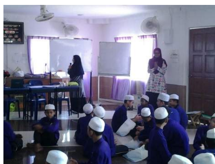
Aktiviti didalam kelas