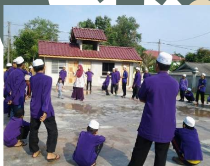
Aktiviti diluar kelas