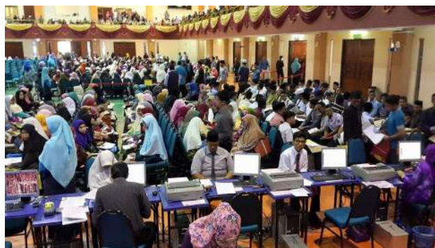
Suasana dihari pendaftaran pelajar baharu KUIS

Adalah menjadi harapan semua insan di dalam KUIS (pelajar, pensyarah, pegawai, kakitangan) dan di luar KUIS (alumni, ibu bapa, majikan, organisasi berkaitan) untuk melihat institusi ini cemerlang dalam semua perkara termasuk dari aspek jumlah kemasukan pelajar baharu dan jumlah graduan berkualiti yang berjaya dilahirkan. Dalam perkataan lain, jumlah kemasukan pelajar yang ramai turut menyumbang kepada usaha melahirkan lebih ramai Dai', Ulama dan Umara dari bumi KUIS.