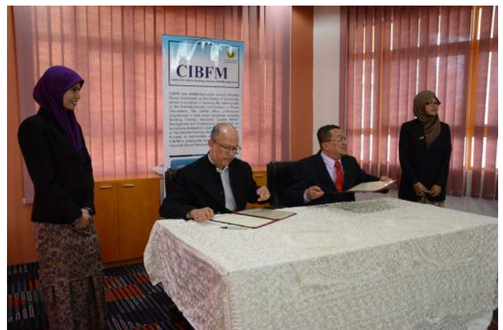
Signing of MoU by CIBFM and KUIS