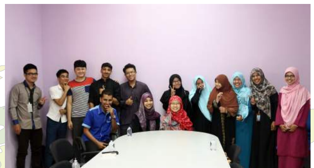
Pelajar antarabangsa bergambar kenangan selepas berjaya menamatkan aktiviti Usrah Bulanan.