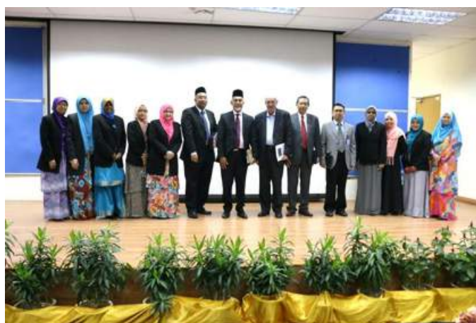
Photography session at the end of the programme