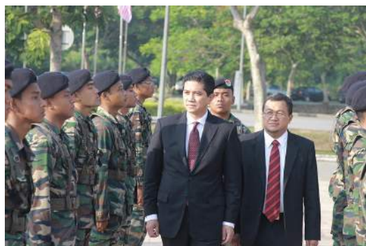
Pemeriksaan Kawalan Kehormat oleh Y.A.B Dato' Menteri Besar Selangor