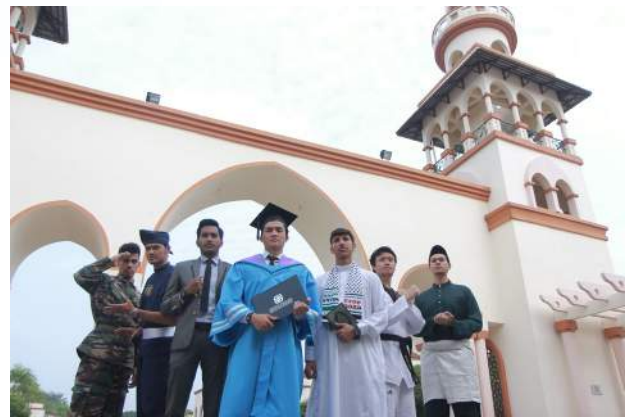
Pelajar antarabangsa turut melibatkan diri dalam usaha promosi KUIS

Oleh yang demikian, ayuh kita sama-sama berganding bahu bagi menjadikan KUIS setanding dengan IPT lain di dalam negara demi melahirkan Da'i, Ulama & Umara'.