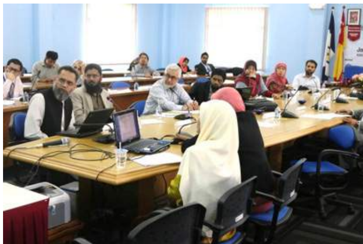
Presentation by the presenters