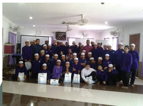
Sesi bergambar diakhir program