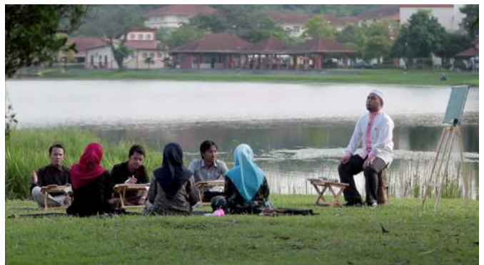
Penghayatan Ilmu dimana sahaja demi melahirkan generasi berkepimpinan

Pusat Kecemerlangan Sepanjang Hayat juga menjalankan aktiviti perniagaan yang menawarkan program-program pensijilan dan diploma eksekutif serta menyediakan program latihan untuk institusi korporat. Malah, KUISCELL tidak ketinggalan untuk melibatkan diri dalam industri penerbitan buku bagi memartabatkan pengetahuan aqli dan naqli.