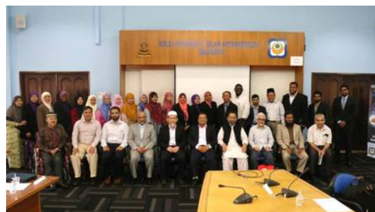
Photography session at the end of the programme