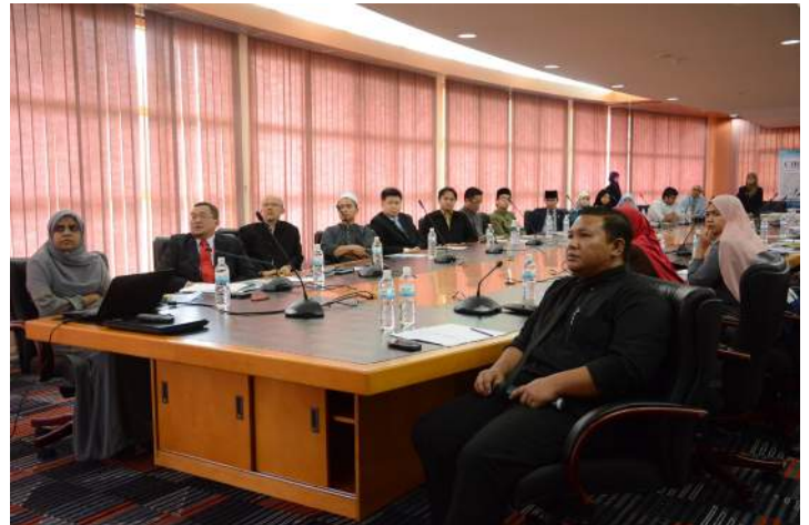
Roundtable discussion on implementation of Sadaqa House as a banking product or service