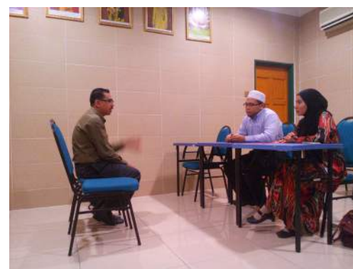
Sesi 'walk-in interview' bagi pelajar program Perguruan, Fakulti Pendidikan