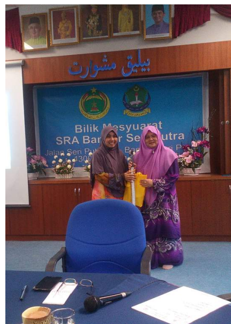
Penyampaian cenderahati kepada Dekan Fakulti Pendidikan