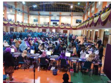
Suasana Pendaftaran di dalam Pusat Konvensyen KUIS.

Kenangan manis sewaktu hari pendaftaran ini diharapkan agar menjadi pemangkin semangat seluruh tenaga kerja di KUIS untuk terus mendidik bakal da'i, ulama dan umara bagi mengembangkan Islam di persada dunia. Semoga para pelajar mendapat manfaat dan keberkatan ilmu disepanjang tempoh pengajian di KUIS. Bersama kita jadikan institusi ini sebagai Pemangkin Tradisi Ilmu untuk kegemilangan duniawi dan ukhrawi.