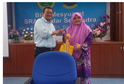
Penyampaian cenderahati kepada Rektor KUIS