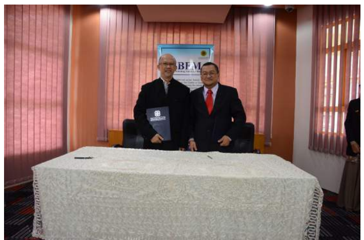
CEO CIBFM with Rector KUIS at the end of ceremony