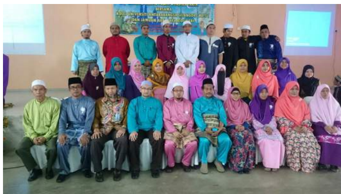
Pengerak utama Maahad Tahfiz Faqeh dan para guru serta wakil KUIS bergambar untuk dokumentasi dan kenangan sempena majlis Mou KUIS-Faqeh.