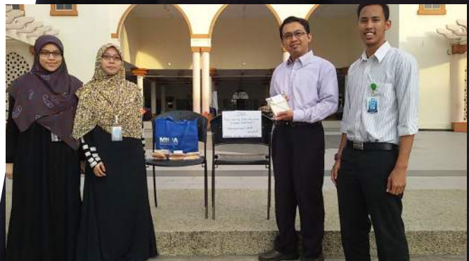
Melancarkan Free Food for You yang diusahakan oleh Majlis Perwakilan Pelajar (MPP) KUIS