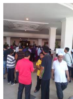
Ibu bapa dan waris pelajar di perkarangan Pusat Konvensyen KUIS.