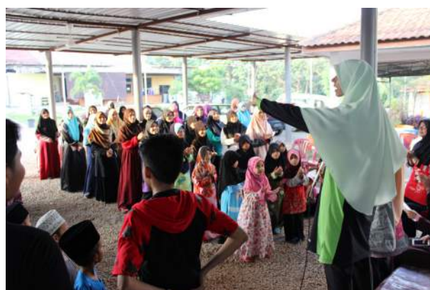
Fasilitator kac mengendalikan aktiviti bersama anak-anak baitul barokah wal mahabbah (bbwm), sepang