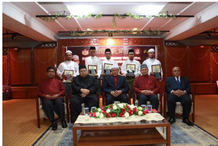
Pemenang Anugerah bersama Y.A.B Menteri Besar Kelantan dan Pegawai Kanan Kerajaan negeri yang menjayakan majlis.