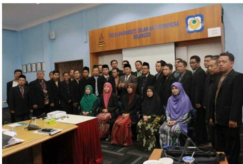
Wakil KUIS bersama pelajar-pelajar dan guru-guru dari STAIN Pekalongan

Majlis di akhiri dengan penyampaian cenderahati sebagai tanda penghargaan dan kenangan. Semoga kerjasama dan ukhuwah yang terjalin diteruskan bagi kelangsungan jihad pendidikan di kedua dua Institusi Pengajian Tinggi Islam ini.