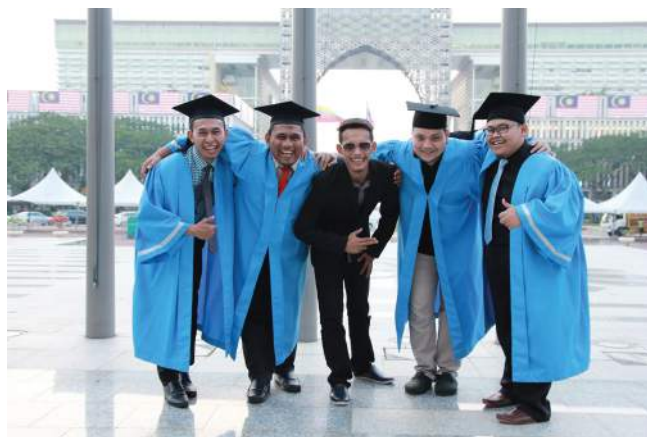
Mahasiswa KUIS sedia kembali ke pangkuan masyarakat untuk menyumbang bakti.

hasil dorongan dan sokongan semua pihak terutama pegawai KUIS daripada bahagian yang terlibat serta para pensyarah.