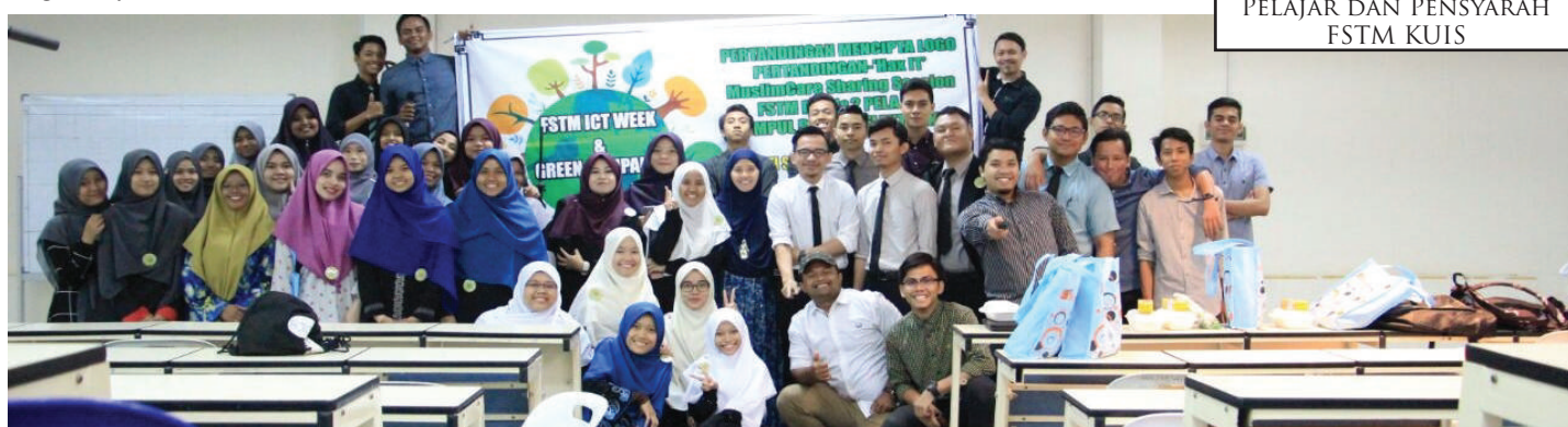
PELAJAR DAN PENSYARAH FSTM KUIS

Pada 7 hingga 9 September 2016 lalu, Fakulti Sains dan Teknologi Maklumat (FSTM), Kolej Universiti Islam Antarabangsa Selangor (KUIS) telah menganjurkan Program 'ICT Week & Green ICT Campaign 2016' yang berlangsung di sekitar FSTM. Program ini dijayakan seramai 70 lebih orang mahasiswa dan mahasiswi semester 5 kursus Diploma Teknologi Maklumat (Multimedia) dan Diploma Sains Komputer dengan hasil kerjasama yang padu kalangan beberapa pensyarah FSTM.