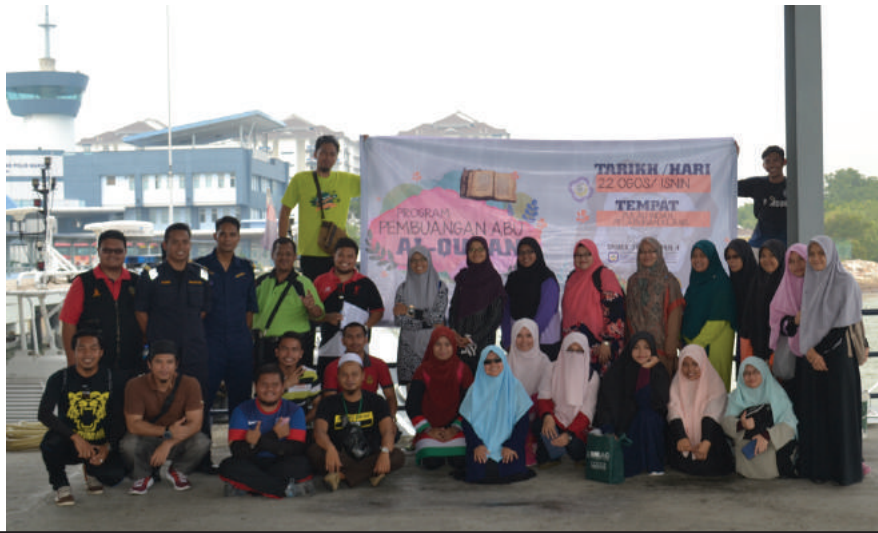
Pelajar Ijazah Sarjana Mudan al Quran al Sunnah dan Komunikasi.