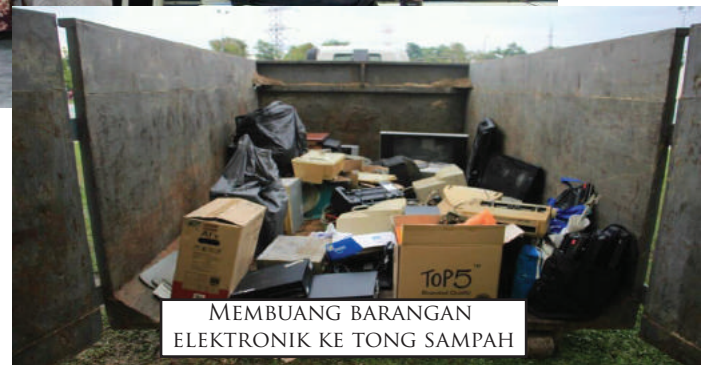
MEMBUANG BARANGAN ELEKTRONIK KE TONG SAMPAH