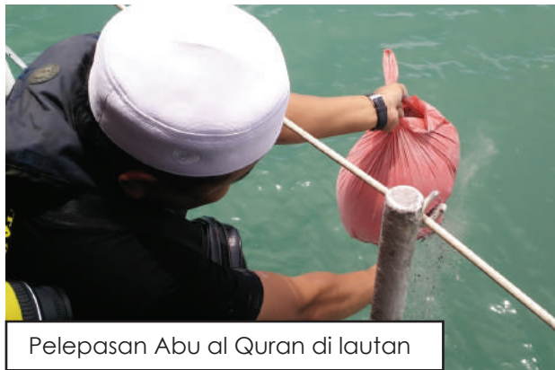
Pelepasan Abu al Quran di lautan