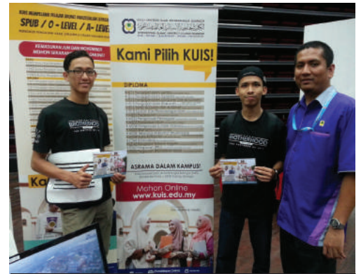
BERSAMA BAKAR PELAJAR KUIS

Projek Khas Gerak Gempur SPM / STPM / STAM 2017 ini melibatkan semua pegawai KUIS secara langsung bagi mensasarkan jumlah kemasukan pelajar 6000 orang pada tahun 2017. Antara negeri yang terlibat dengan program ini ialah Selangor, Negeri Sembilan, Melaka, Kelantan, Terengganu, Kedah, Perak dan Johor.