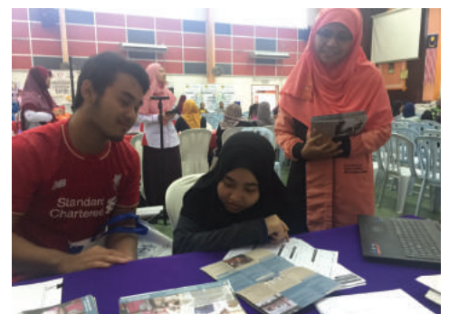
MEMBERI PENERANGAN KEPADA BAKAL PELAJAR