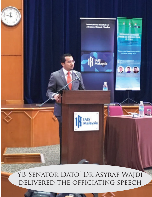
YB SENATOR DATO' DR ASYRAF WAJDI DELIVERED THE OFFICIATING SPEECH