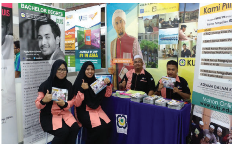
SEKRETARIAT PEMASARAN DAN KOMONIKASI KUIS