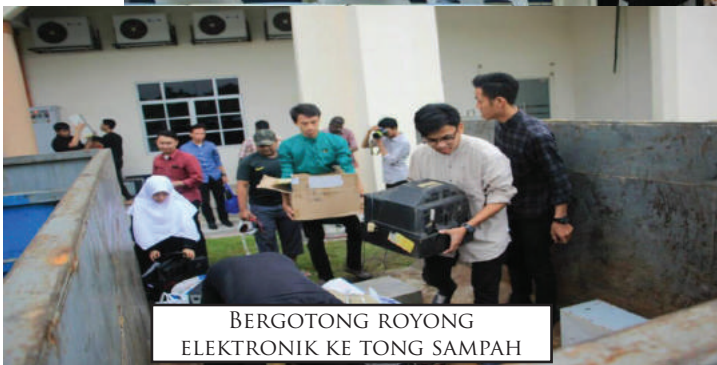
BERGOTONG ROYONG ELEKTRONIK KE TONG SAMPAH