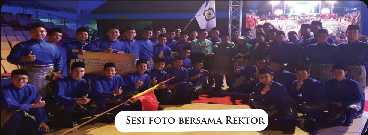
SESI FOTO BERSAMA REKTOR