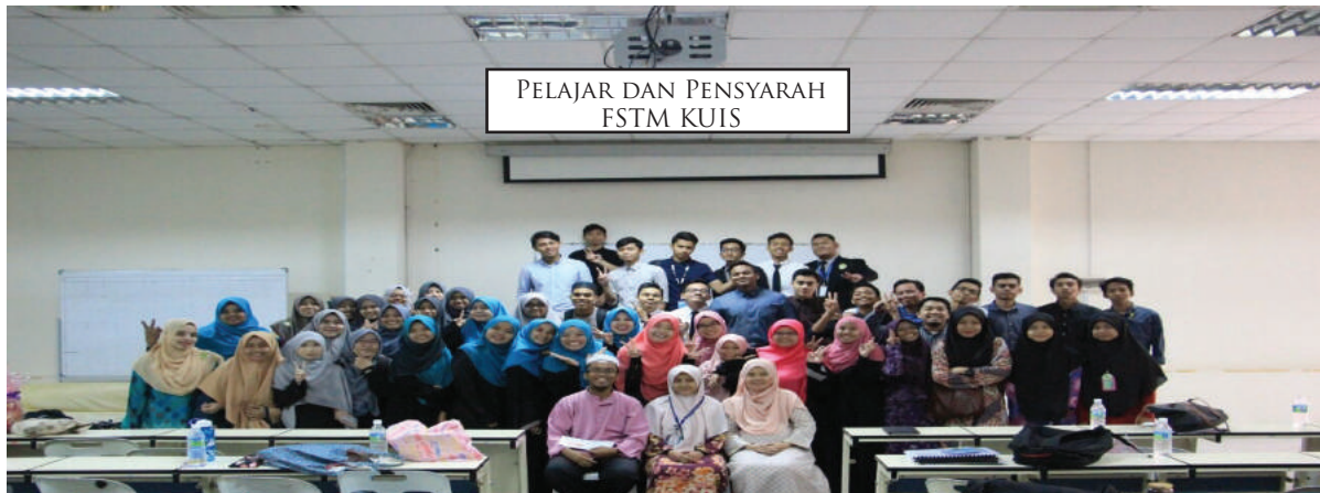
PELAJAR DAN PENSYARAH FSTM KUIS