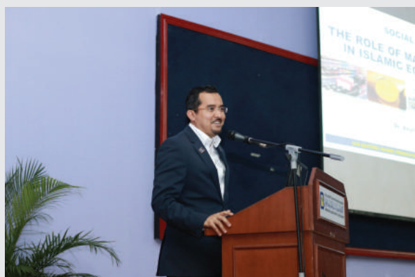
PUBLIC LECTURE BY YB SENATOR DATO' DR ASYRAF WAJDI DATO' DUSUKI