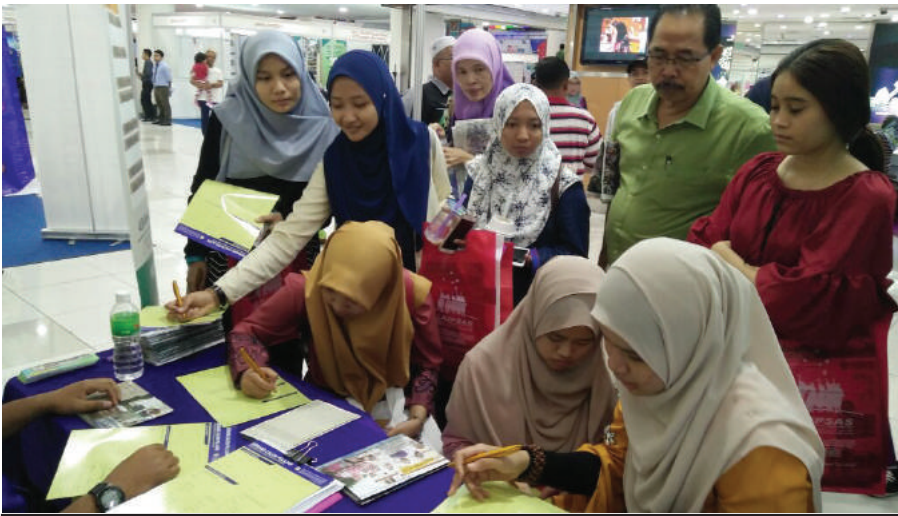
PELAJAR DAN PENGUNJUNG MELAWAT GERAI KUIS