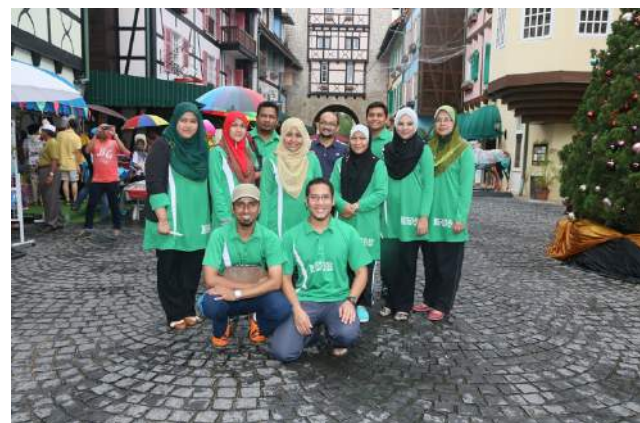
Pegawai MARCOM bersedia untuk menyertai "mencari harta karun" di persekitaran Colmar sebagai acara penutup.