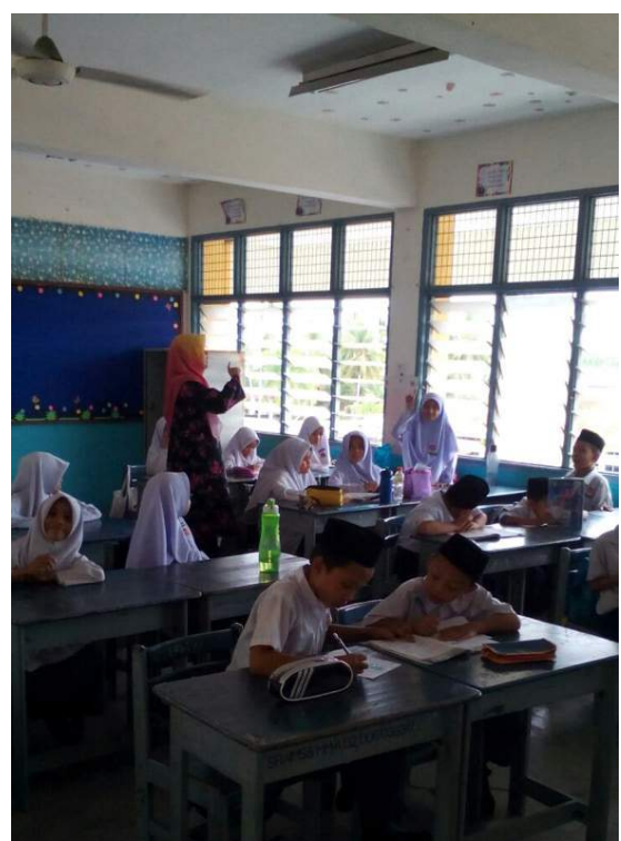
Guru pelatih mengajar di dalam kelas.