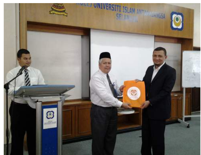
Timbalan Rektor (Akademik & Penyelidikan) KUIS menyampaikan hadiah kepada Naib Pematuhan Presiden Syariah Bank Rakyat.