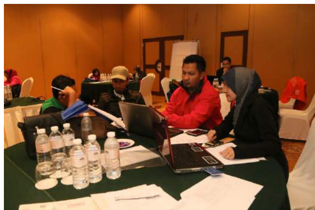
Memerah otak menyediakan task yang diberi.