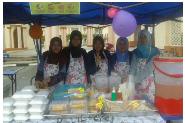
Sebahagian pelajar FSTM yang terlibat menjayakan Program Hari Usahawan FSTM 2015