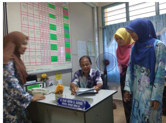
Guru pelatih bertanya sesuatu kepada staf sekolah.