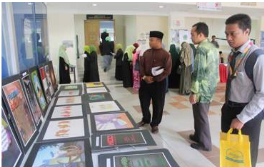
Hasil Kreativiti pelajar dipamerkan untuk tontonan orang ramai.