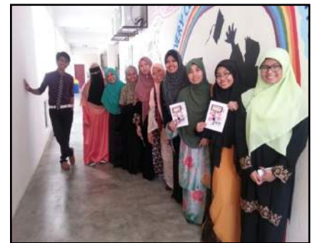
Bergambar semasa sesi lawatan di sekitar Resoure Area. Turut kelihatan adalah Buletin Ace Movement edisi 1 iaitu Vibes.