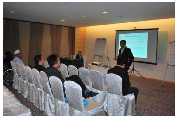
Sesi pembentangan selari (parallel sesiion)