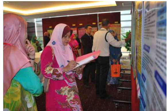
Para juri menilai kualiti perbentangan poster yang dipertandingkan