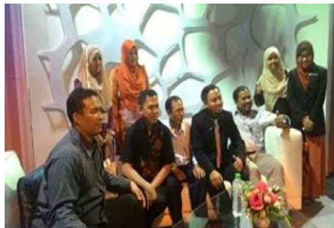
Gambar kenangan di RTM, Selamat Pagi Malaysia