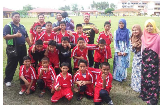
Guru pelatih bergambar bersama pasukan bola sepak sekolah.

Latihan dan bimbingan yang diterima sewaktu belajar di Fakulti Pendidikan turut membantu para pelajar dalam menyediakan bahan bantu mengajar yang memudahkan lagi proses P&P di dalam kelas. Secara keseluruhannya, sesi praktikum ini dapat melahirkan pendidik berkualiti yang menjadi rebutan para pentadbir sekolah dan seterusnya menjadi aset berharga kepada dunia pendidikan di Malaysia.