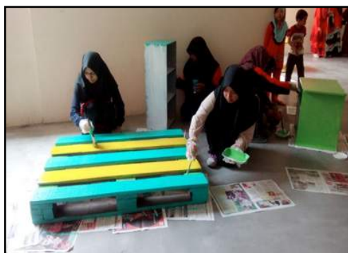
Sesi mengecat sebelum hari pelancaran.

Diharapkan agar sudut bacaan ini akan menjadi sumber inspirasi semua pelajar dan tenaga pengajar dalam melaksanakan proses pengajaran dan pembelajaran yang berkesan pada masa akan datang. Semoga sudut ini menjadi sedekah yang berterusan pahalanya kepada semua warga KUIS; seperti yang diriwayatkan oleh Abu Hurairah r.a: Rasulullah S.A.W bersabda, " Apabila seorang anak Adam mati putuslah amalnya kecuali tiga perkara : sedekah jariah, atau ilmu yang memberi manfaat kepada orang lain atau anak yang soleh yang berdoa untuknya." (Hadith Sahih - Riwayat Muslim).