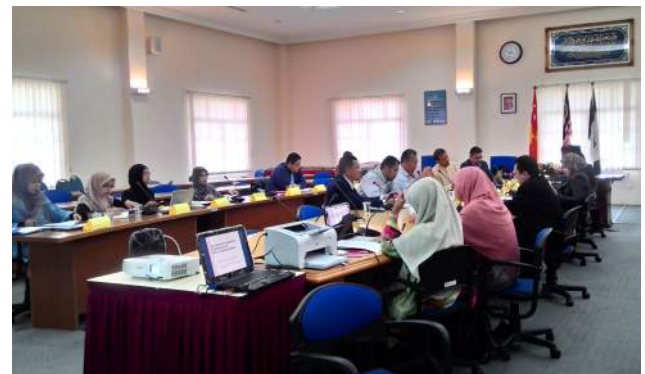
Sesi perbincangan dua hala antara Bank Rakyat dengan IRCIEF berjalan lancar.

Perbincangan Meja Bulat ini diharapkan akan menjadi langkah permulaan kepada ahli akademik KUIS untuk terus terlibat dalam perbincangan ilmu dengan ahli akademik IPTA dan pihak industri bagi meningkatkan kecemerlangan ahli akademik KUIS dalam bidang kepakaran masing-masing. Harapan IRCIEF agar perkongsian ilmu ini akan memberi sumbangan yang bermanfaat kepada sistem kewangan Islam di Malaysia dan ummah secara keseluruhannya.