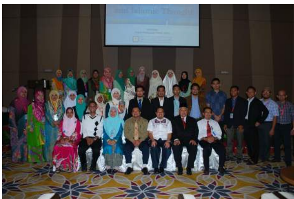
Peserta, Pembentang dan Jawatankuasa penganjur ReCIT 2014 bergambar untuk kenangan.

Selain pembentangan selari, seminar ini juga menganjurkan Pertandingan Pembentangan Poster Penyelidikan, yang mana pertandingan ini telah disertai oleh 16 kumpulan penyelidik. Tiga daripada kumpulan yang terbaik telah dipilih sebagai pemenang pingat emas, perak dan gangsa. Sebagai kesinambungan kepada ReCIT2014 yang merupakan seminar pertama yang telah berjaya dianjurkan, PPT akan meneruskan siri ReCIT yang berikutnya pada 2015 serta menjadikan ReCIT sebagai seminar tahunan anjuran PPT.