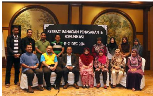
Pegawai MARCOM bersama Dato' Rektor dan Isteri.

Semua Unit di bawah MARCOM telah memperincikan data-data dan keperluan asas sebelum menyertai Program Retreat agar proses gerak-kerja berjalan dengan lebih lancar. Program Retreat MARCOM telah berjaya mencapai objektif yang ditetapkan dan akan membukukan Takwim MARCOM 2015 sebagai rujukan dan landasan gerak-kerja sepanjang tahun.