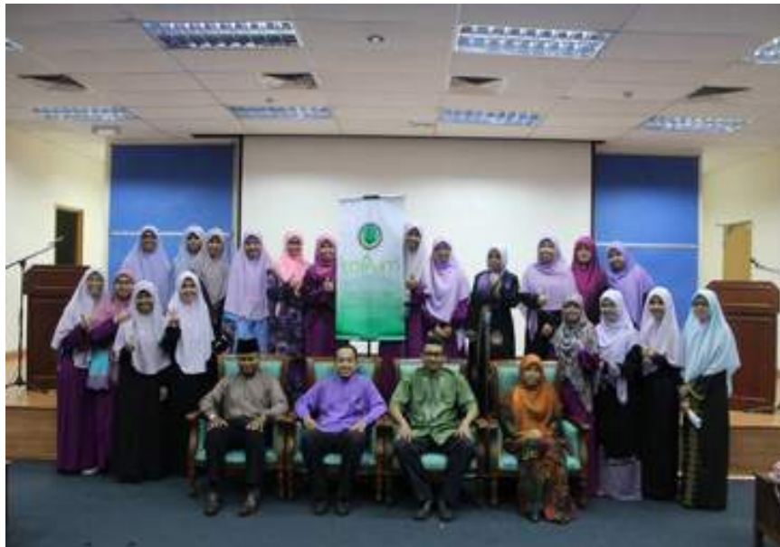
Pelajar bersama Pensyarah Jabatan Usuluddin, Akademi Islam bergabung tenaga menjayakan KoPUM 2015

Program ini merupakan salah satu usaha yang berterusan dalam mendidik pelajar dan seiringan dengan fenomena kebangkitan Islam. Jabatan Usuluddin kali ini telah membuat penambahbaikan dengan melibatkan pembentangan dari kalangan pelajar tahun akhir untuk Latihan Ilmiah (tesis), Final Year Project 1 dan Final Year Project 2. Kolokium ini secara khusus membicarakan isu-isu pemikiran Islam semasa dan multimedia sama ada melalui penyelidikan secara kualitatif atau kuantitatif. Matlamat utama Jabatan Usuluddin mengadakan Kolokium ini adalah memberi peluang kepada pelajar mengemukakan hasil projek multimedia dan tesis mereka secara ilmiah dari sudut isu-isu semasa Islam dan juga multimedia.